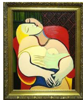
Le rêve, Picasso, 1932.

À partir de ce point d'impossible, nous pouvons lire le rêve et son interprétation comme la réponse à la tentative d'écrire le rapport sexuel dans le couple qu'elle forme avec son ami. Ce qui fait retour dans le réel du rêve et son interprétation doit être mesuré par l'analyste à l'aune de la singularité du sujet en analyse. Le rêve où un incube vous écrase de tout son poids est un rêve transclinique. Par conséquent, l'intervention de l'analyste dépend de la possibilité ou non de situer ce point dans le cadre du fantasme et, au-delà de celui-ci, dans la singularité en tant que telle, où le point de non reconnu se situe.